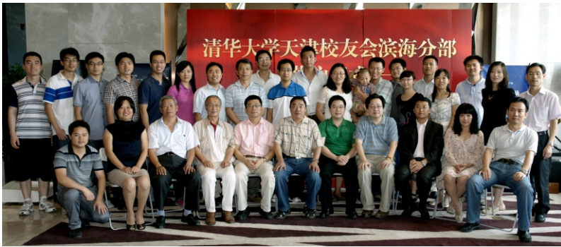
部分校友嘉宾合影