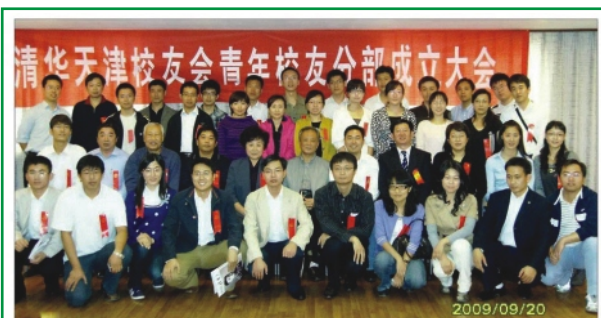
清华天津校友会青年校友分部成立大会