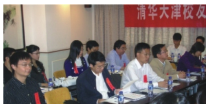
天津校友会 青年校友分部 成立大会