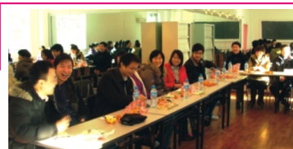
青年校友分部 迎春茶话会