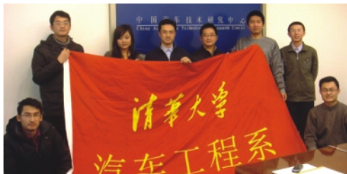
母校汽车系在校生 参观中国汽车研究中心