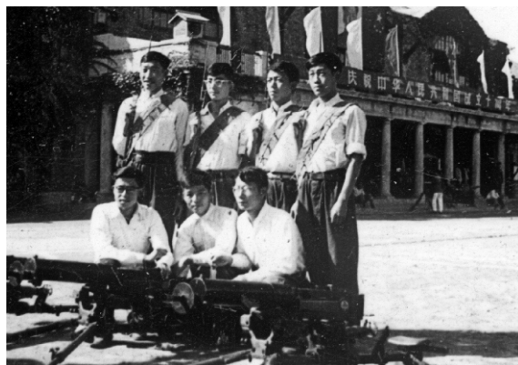
操练后在西操场，后排左1为作者

蓝天，白云，天安门广场。一群身着白上衣、蓝裤（裙）子、同共和国一起诞生的十岁少年，欢笑着、奔跑着、放飞着手里的和平鸽。这是纪录片《第十个春天》开始的场景。1959年，我们中华人民共和国诞生10周年。